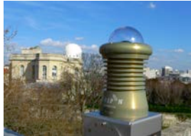
Caméra FRIPON