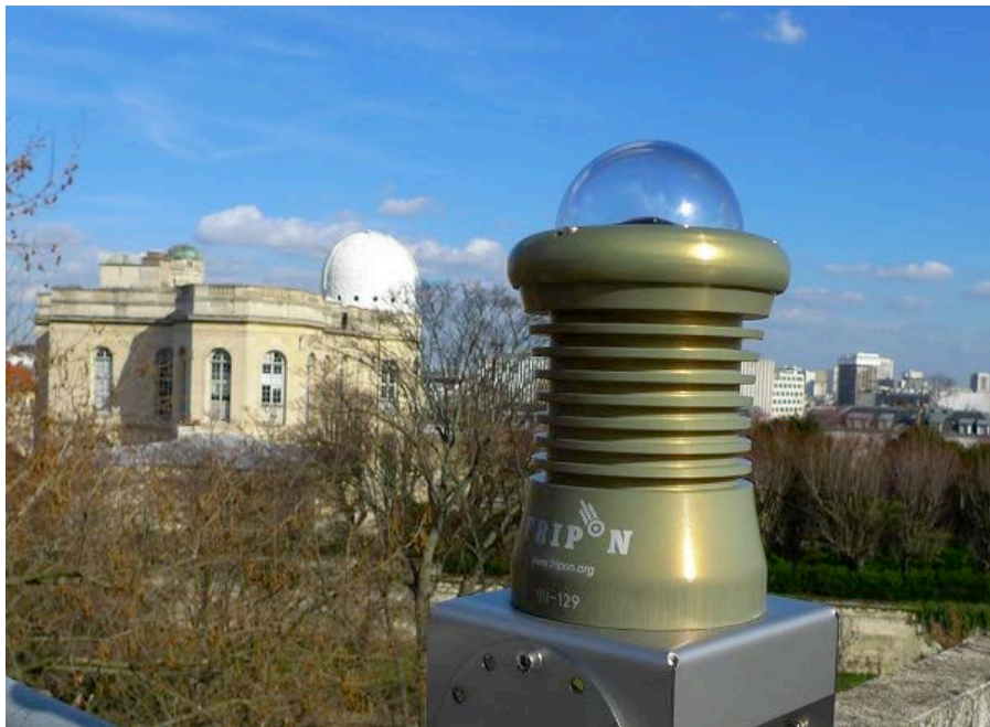
Caméra FRIPON implantée sur le toit de l'Observatoire de Paris.

Dans les faits, le dispositif FRIPON sera relayé sur le terrain par le réseau Vigie-Ciel, piloté par le Muséum national d'Histoire naturelle et qui sera lancé en 2017. Ce programme de science participative va permettre d'organiser des recherches sur le terrain rapides et efficaces. Des battues seront organisées avec la participation de bénévoles chercheurs de météorites, formés grâce au projet Vigie-Ciel.